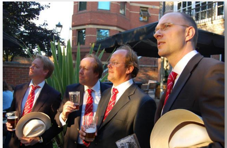
Een traditionele cantorijborrel na afloop van de eerste evensong in Windsor. Louter tevreden gezichten...

Nu heb ik het nog niet eens gehad over de psalmen. Hoe meer onpoëtische liederen er in de Nederlandse eredienst gezongen worden, hoe meer ik weer ga houden van de psalmen. Die dichters hadden lef: ze schreeuwden het uit, van vreugde of verdriet. En de Engelse chant laat ze zingen wat ze zongen. Vertaald, weliswaar, maar niet berijmd en dus dicht bij de brontekst. De kunst is zingend poëzie voor te dragen. Die kunst zijn de Engelsen goed meester, en wij proberen hun voorbeeld naar beste kunnen te volgen. Dat te hebben gedaan in echte koorbanken, met heuse schemerlampjes, voelt ietwat droomachtig.