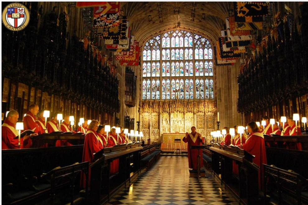
De Leidse Cantorij in St. George's Chapel