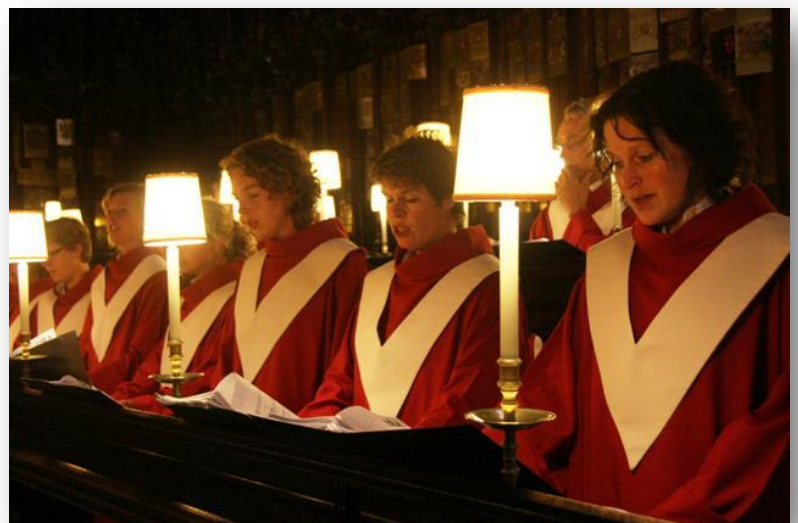
In de koorbanken van St. George's Chapel.